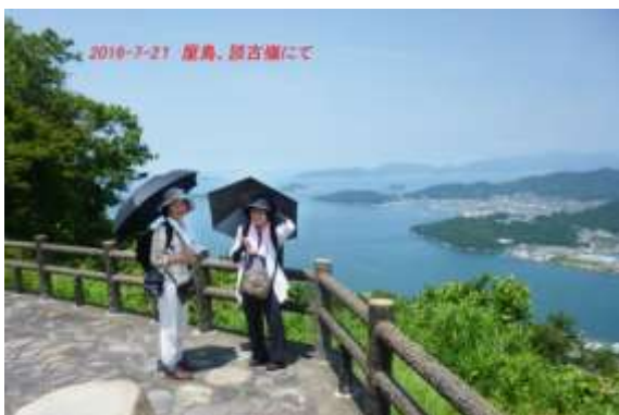
屋島談古嶺から瀬戸内を望む