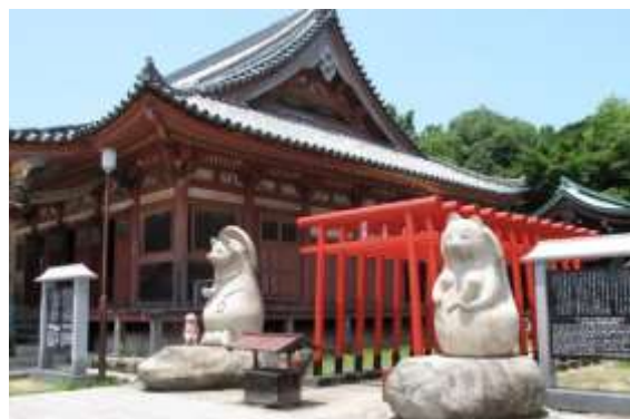
屋島寺境内に鎮座する雌雄二体の大狸