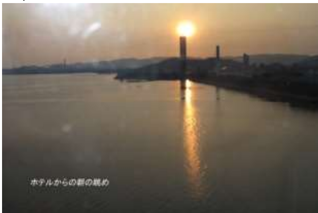
ホテルからの朝の眺め