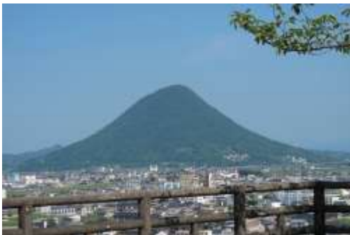
讃岐富士が迎えてくれました