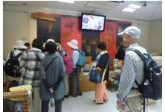
うちの港ミュージアムで