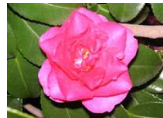
1月の花 カンツバキ

原稿は土井一実 メールアドレス dok.riki@iris.eonet.ne.jp