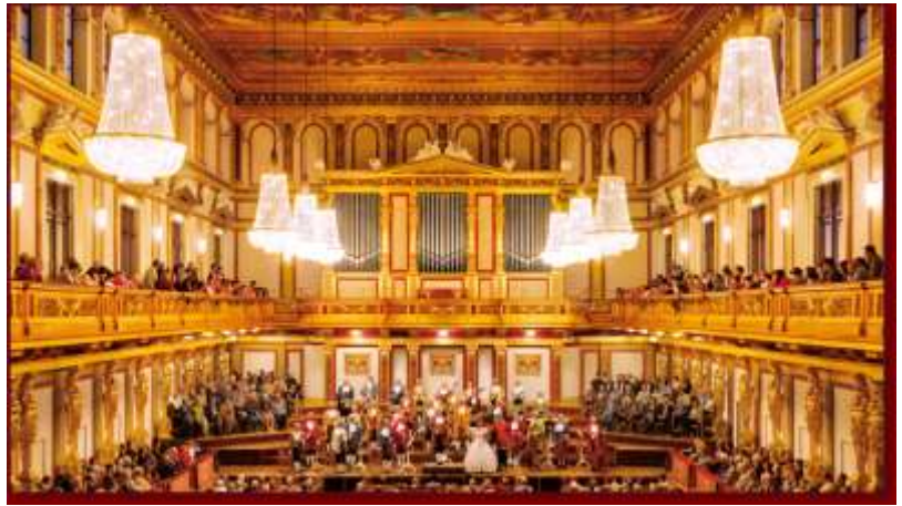
ウィーン楽友会大ホール(黄金の間)

○美しき青きドナウ川流域の映像風景と川の流りに調和した明るく綺麗な建造物等にも堪能させられた。