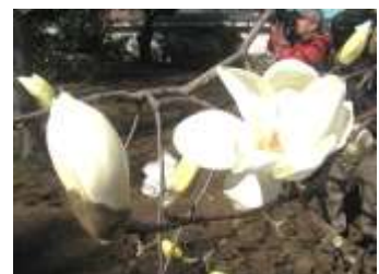
3月の花 ハクモクレン

原稿は土井一実 メールアドレス dok.riki@iris.eonet.ne.jp ☎・Fax 738-2376 又は、お近くの地区幹事までご連絡ください。