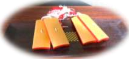
四つ竹(琉球舞踊の打楽器)

老大 26期健康福祉を73歳で受講した、同期には琉球舞踊のお師匠さん(女性)がおられ、沖縄伝統の“四つ竹”踊り[四つ竹の会]を全員でスタートした 今も引き続き、26期の美人7名がリーダーを取り、高齢者大学修了者等の入会で現在女性約35名が月2回の練習に励んでいる。恒例の文化祭とボランディアでの「吹田あいほ一ぷ」夏祭り等に参加され、何時までも若々しく元気な姿で活躍しておられる。