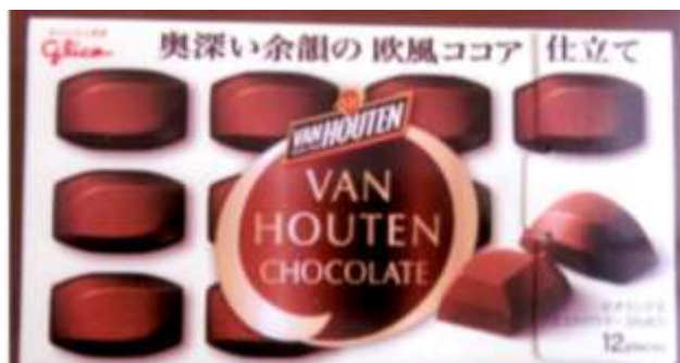
ホールインワン賞