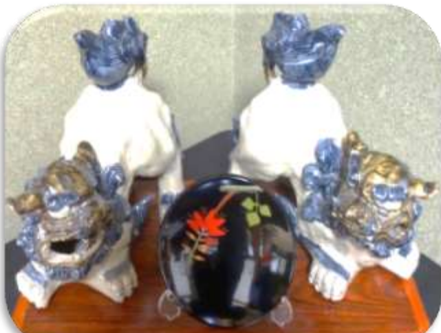
シーサー(魔除けの獅子)とデイゴ(県花)の漆器