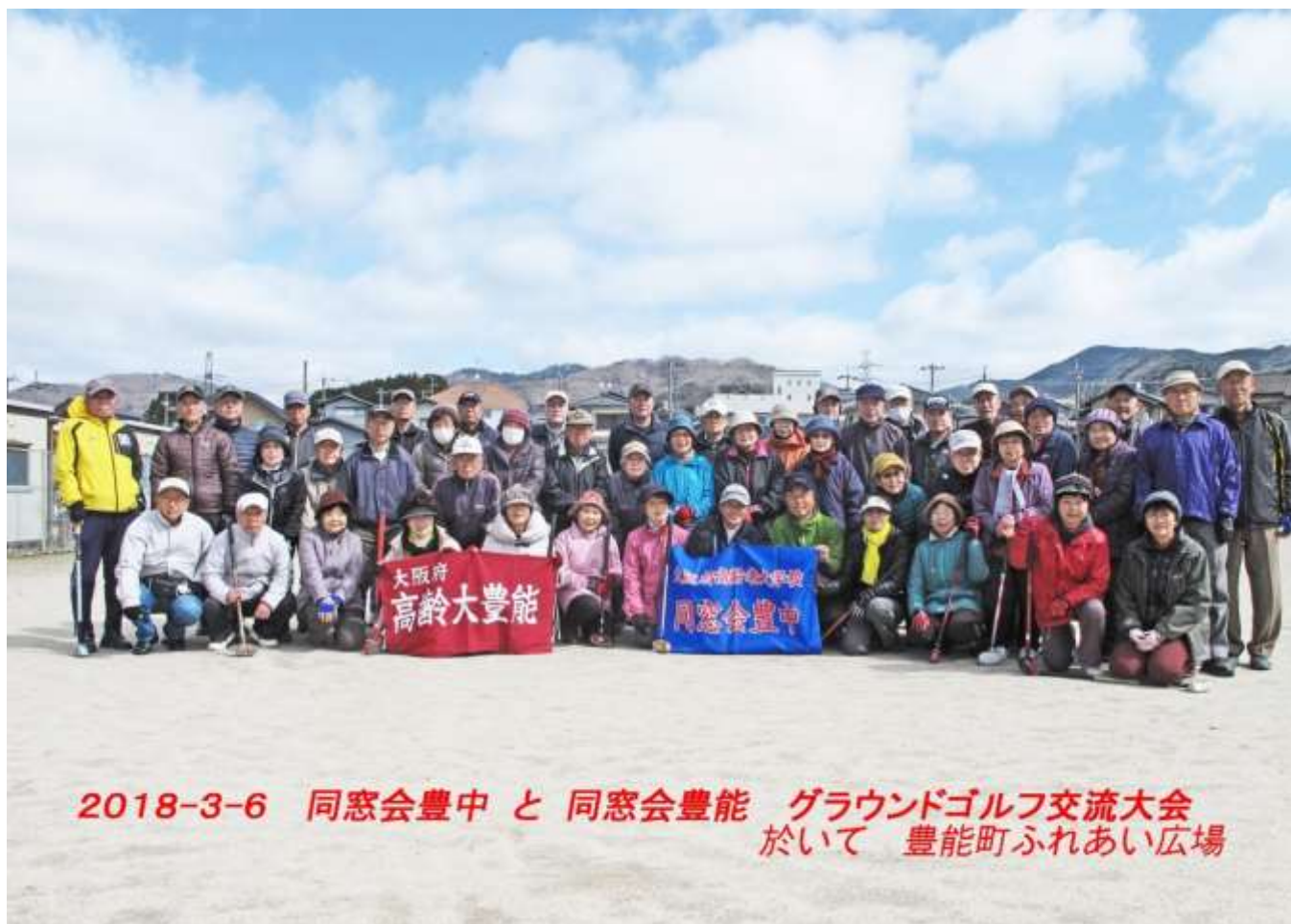
2018-3-6 同窓会豊中 と 同窓会豊能 グラウンドゴルフ交流大会 於いて 豊能町ふれあい広場